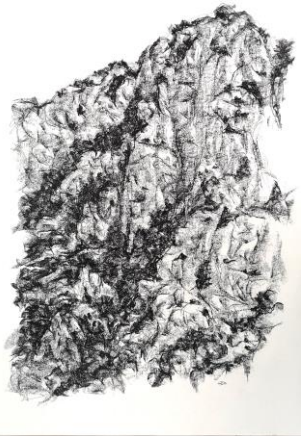
Graphite sur papier Formats de 50X65 cm à 80X120cm